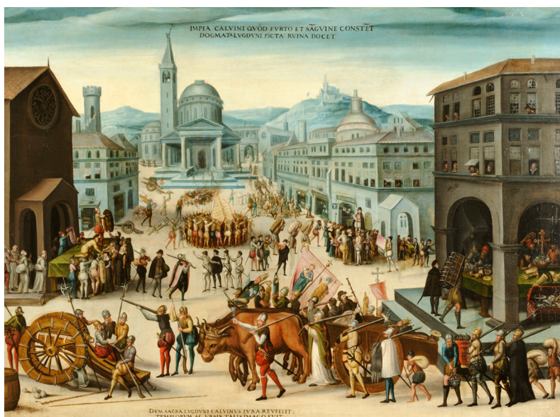
De kerken van Lyon worden aangevallen door de calvinisten (protestanten) in 1562.