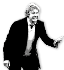
Langs de zijlijn

mededeling voor me heeft. Wat is dat voor gedoe? Er staat nog een fotootje bij ook. Ken ik die man? Ik moet zeggen: hij komt me vagelijk bekend voor. Maar dan ook alleen maar vagelijk. Het is typisch zo een gezicht van Jan en alleman. Misschien dat hij daarom J. heet.