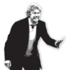
Langs de zijlijn

Er is een tijd geweest, dat niemand mij iets hoefde te vertellen over de nieuwe media. De nieuwe media bestonden toen uit een pc, een modem en floppy disks. Al die prachtige en nuttige dingen die je daarmee kon doen, die kon ik ook doen. Geen punt. Als ik een bestandje had, bijvoorbeeld een artikeltje, dat ergens aan de andere kant van het land terecht moest komen: ik wist