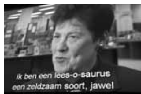
"Als de dinosaurïers hadden kunnen lezen, waren ze nu niet uitgestorven geweest..."