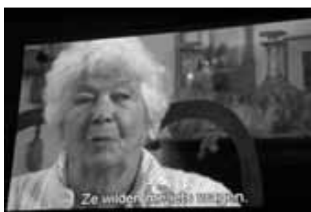
De zus van Katherine Hepburn: ook een bibliothecaresse