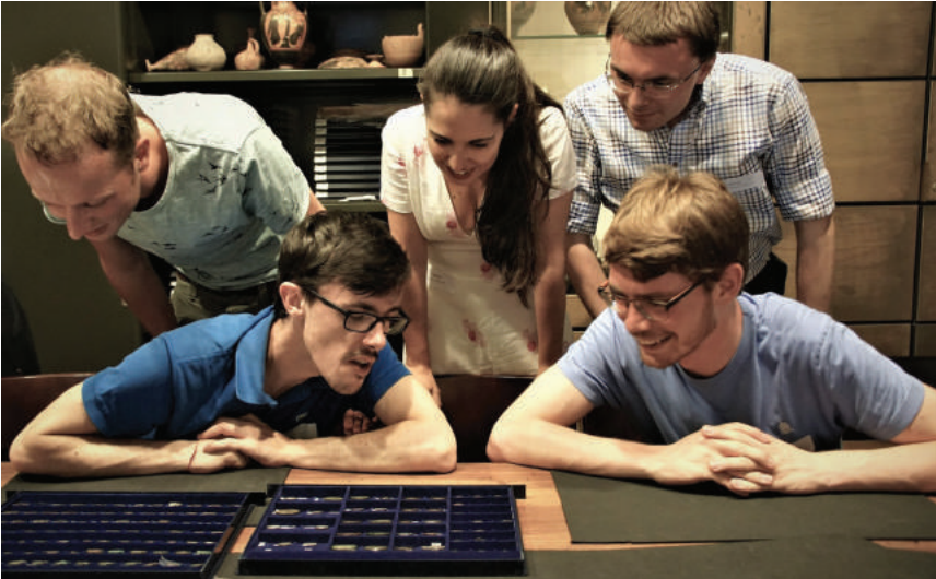
Masterclass, Rome 2019