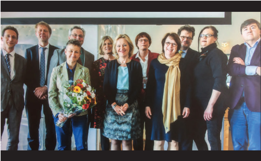
Uitreiking Zwaartekracht 2017