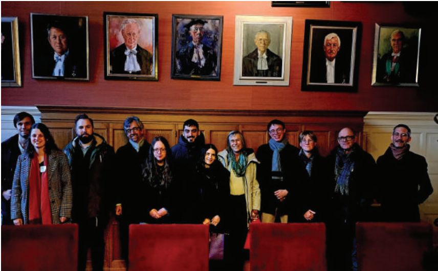
MSAC-OIKOS seminar, Münster 2023