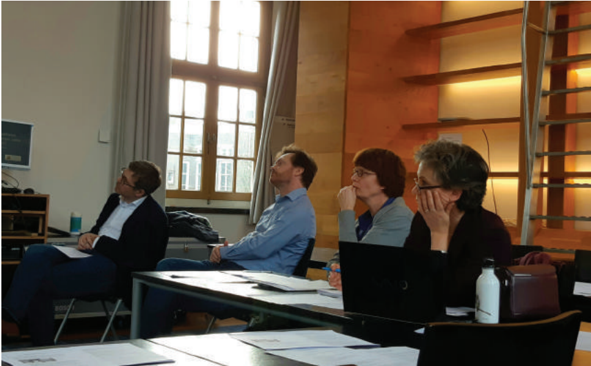
Workshop Energeia and Immersion, Leiden 2020