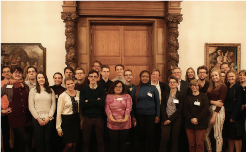
Annual Meeting of Postgraduates in the Reception of the Ancient World in Nijmegen, 2019