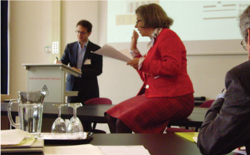
OIKOS-congres 2012 in Ravenstein