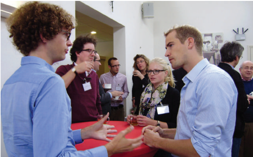
OIKOS-congres, Ravenstein 2012