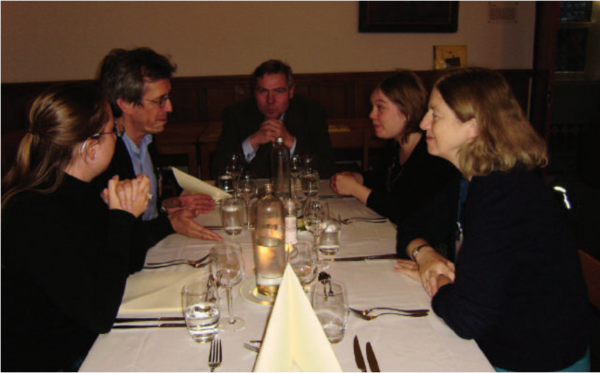
OIKOS-congres, Ravenstein 2012