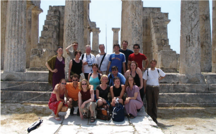
Masterclass, Athene 2006