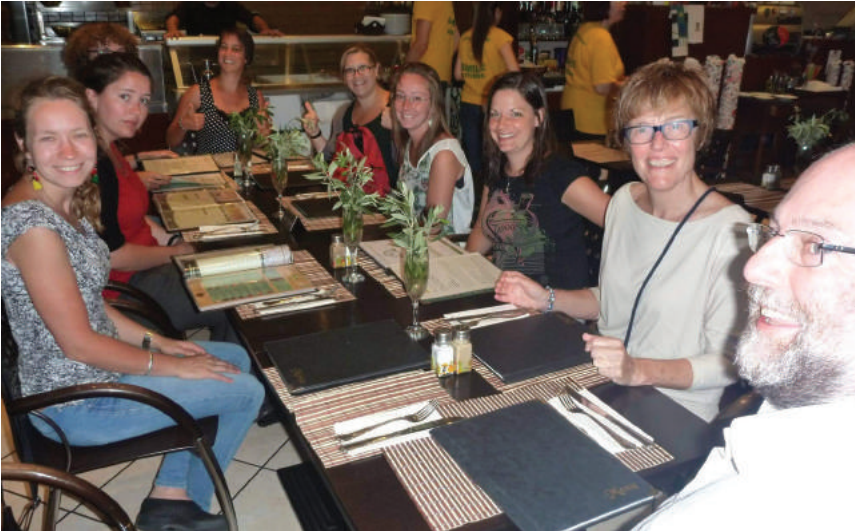
Masterclass, Athene 2014