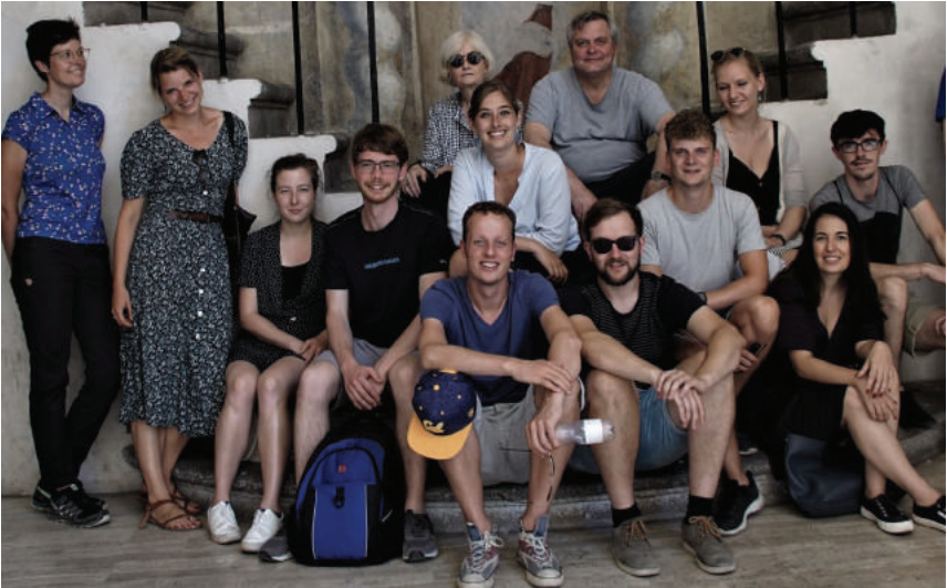
Masterclass, Rome 2019