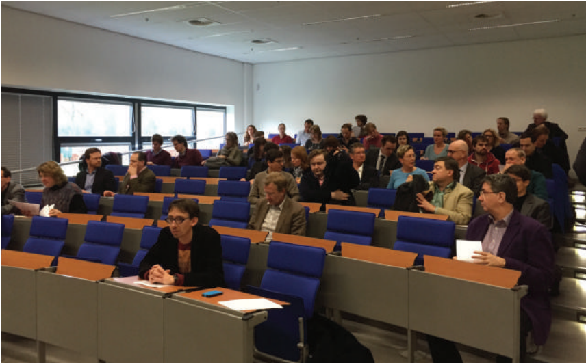
Kick-off Anchoring Innovation 2014