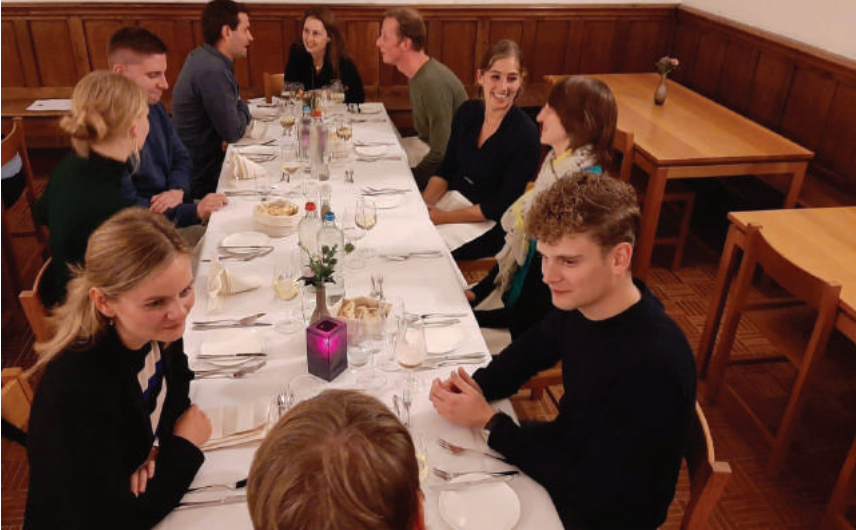
International PhD Days, Ravenstein 2019