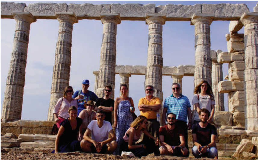
Masterclass, Athene 2017