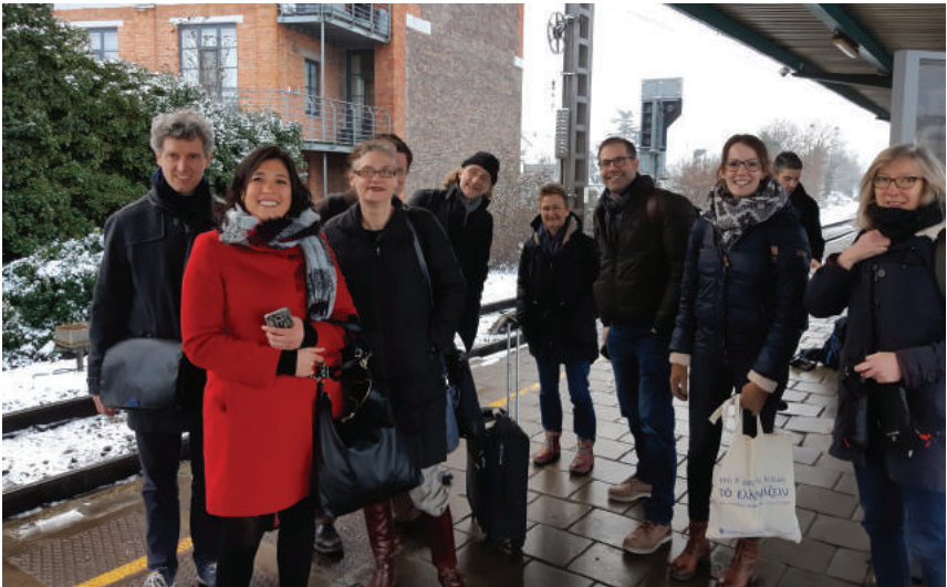
Onderweg naar OIKOS-dag in Gent 2019