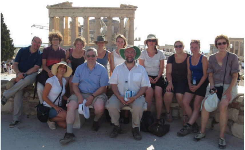
Masterclass, Athene 2014