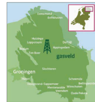
Het Groningenveld.