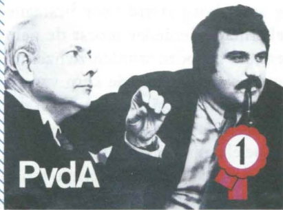
Verkiezingsposter PvdA 1972 Joop den Uyl.