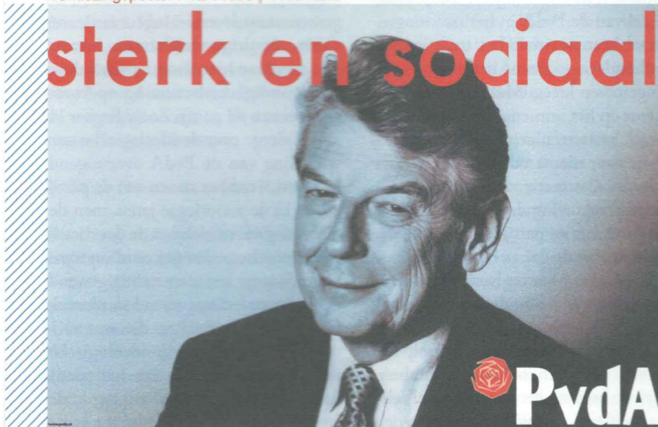
Verkiezingsposter PvdA 1998 | Wim Kok.