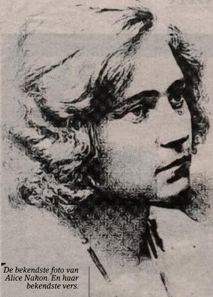
De bekendste foto van Alice Nahon. En haar bekendste vers.