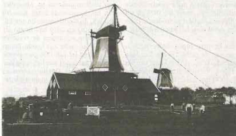
De houtzaagmolen De Twee Gebroeders van de familie Van Houten.

Van Houten bleef tot op hoge leeftijd actief in de politiek. Hij overleed in 1930 op 93-jarige leeftijd. „Het is vreemd dat de naam Van Houten in Groningen amper is terug te vinden. Er is een straat naar hem vernoemd en sinds kort een buurtcentrum (Bij Van Houten, red.), maar dat de vader van de kinderwet een Groninger was, is nagenoeg vergeten. Een standbeeldje zou toch mooi zijn.”