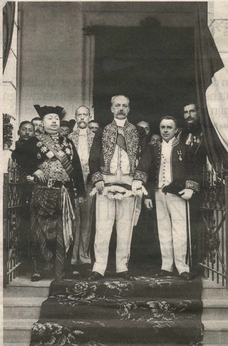
Gouverneur-generaal Idenburg in 1915 op bezoek bij de Soesoehoenan van Solo Pakoe Boewono X, vorst van Soerakarta (links van hem)

Idenburg deed een aantal dingen waardoor je hem nu aan de goede kant van de geschiedenis zou plaatsen. Als minister gaf hij Indonesiërs meer ruimte in het lokale bestuur. Hij was verantwoordelijk voor de eerste 'dessa-scholen'. En daarbij zette hij ook in op meisjesonderwijs, want, schrijft Van der Jagt, 'een ontwikkelde vrouw bracht ontwikkelde kinderen voort', zo was de gedachte. Vanuit die gedachte kwam er ook een doktersopleiding voor inlandse vrouwen. Aletta Jacobs was aangenaam verrast toen ze bij Idenburg op bezoek kwam.