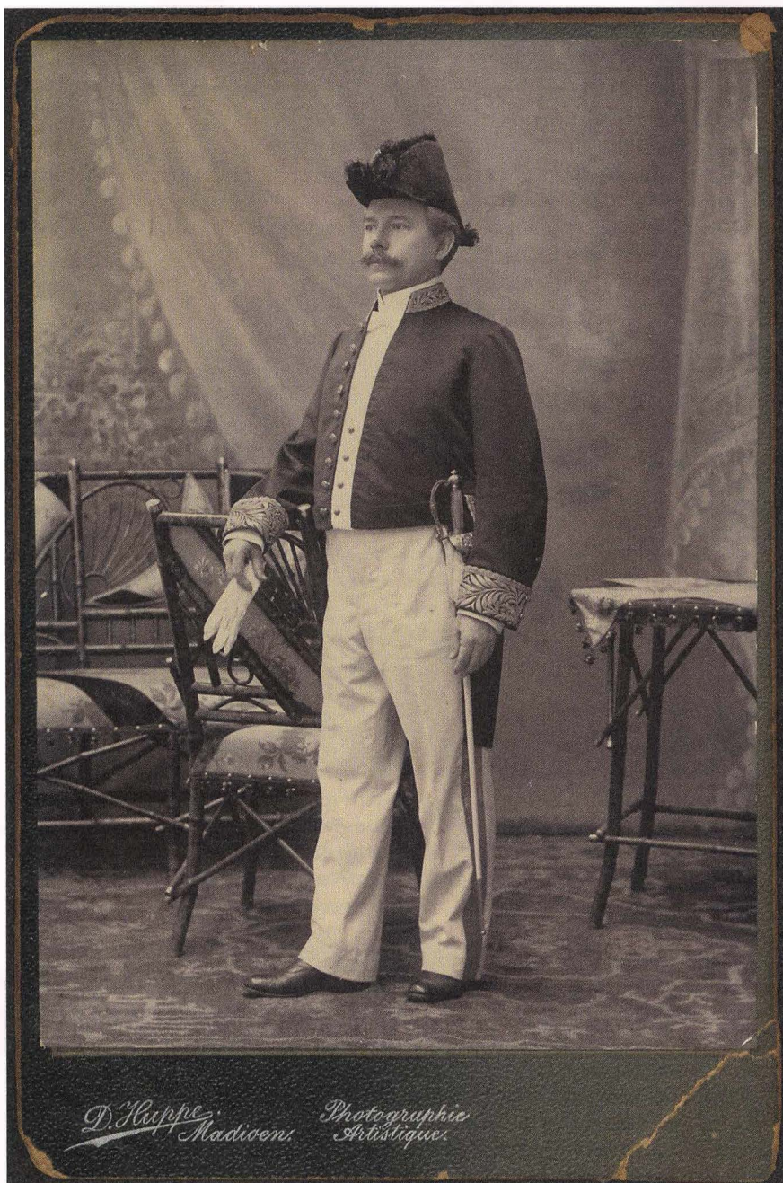
D. Huppe / Leiden Universiteitsbibliotheek