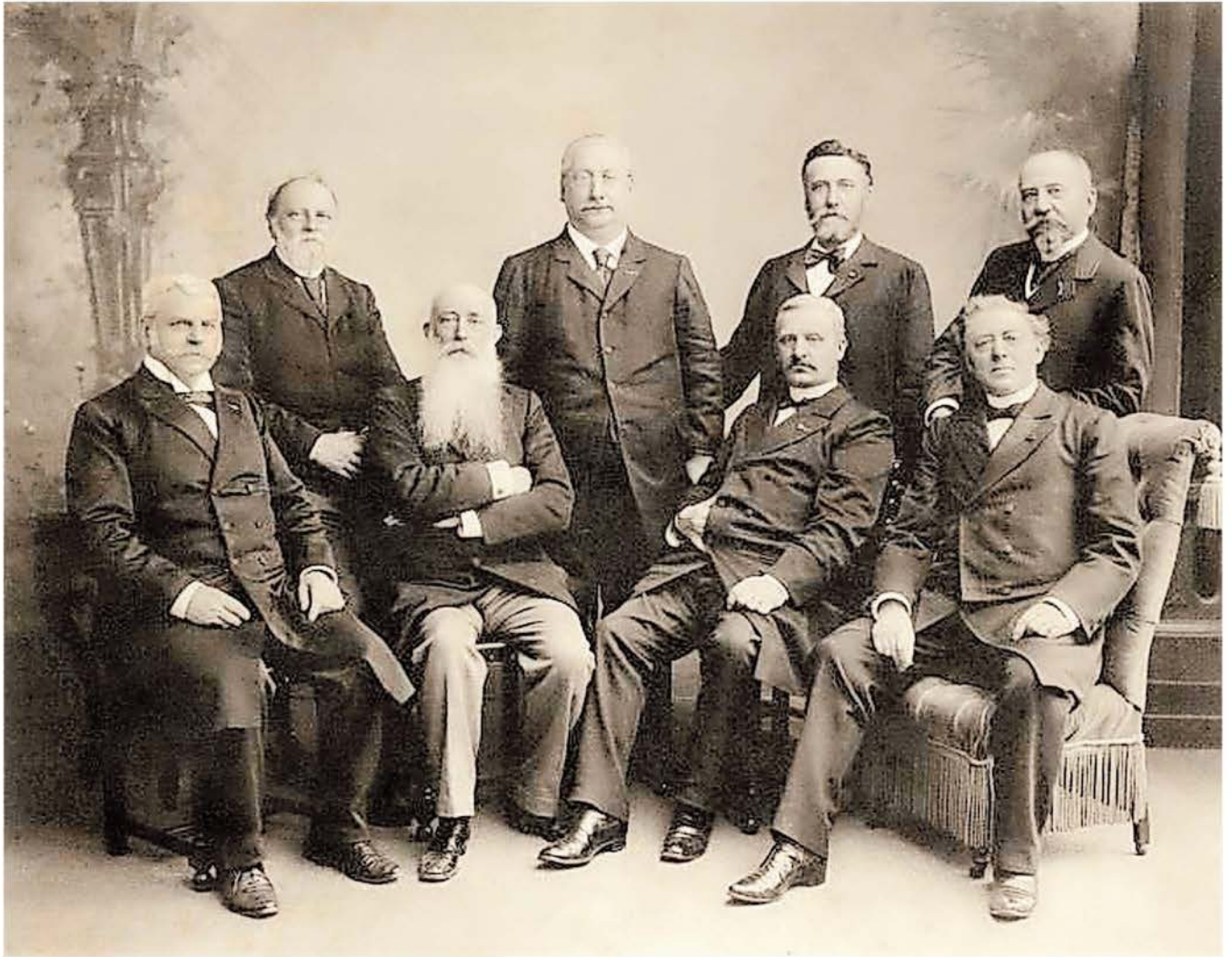
Het kabinet-Roëll (1894-1897). Links achter Sam van Houten.