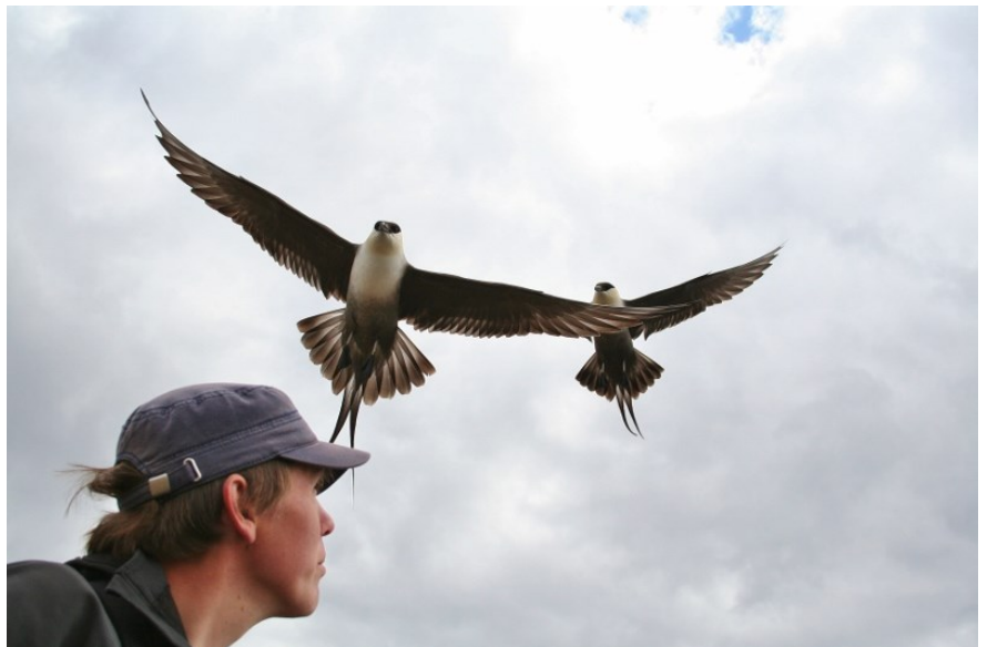
Rob van Bemmelen met 2 kleinste jagers

Allerlei aspecten! Het veldwerk is natuurlijk fantastisch: het vangen en observeren van vogels en het wekenlang struinen over de Zweedse en Noorse toendra! Als fanatiek vogelaar, met bijzondere interesse in zeevogels, voelt het als een enorm voorrecht om met (deze) vogels te mogen werken. Het analyseren van de data is uitdagend en vereist creativiteit. Daarnaast is ook de samenwerking met buitenlandse onderzoekers die op Groenland en Spitsbergen werkt is erg leuk en inspirerend.