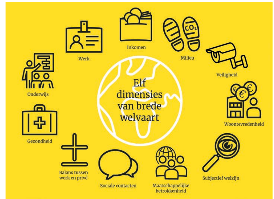
Figuur 1: mogelijke indicatoren van brede welvaart.