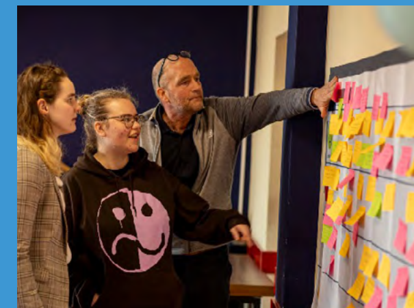
Expeditie het Gezonde Noorden

Dat Aletta richtinggevend is in visievorming op onderwijs van de toekomst en een belangrijke rol speelt in het samenbrengen van partners die deze visie ten uitvoer brengen, blijkt bij uitstek uit de ontwikkeling van de minor Expeditie het Gezonde Noorden. Deze minor brengt studenten met verschillende achtergronden (MBO, HBO en WO) samen. Zij werken met inwoners en maatschappelijke organisaties aan een complex gezondheidsprobleem. In hun leerproces werken ze gezamenlijk toe naar een uitkomst waar de belanghebbenden daadwerkelijk mee geholpen zijn. Deze vorm van onderwijs is grensverleggend en waardevol, omdat alle betrokken partijen een stem krijgen en er wordt gewerkt aan actuele vraagstukken die in de praktijk obstakels vormen in de transitie van zorg naar gezondheid. De minor kreeg een subsidie van ZonMw.