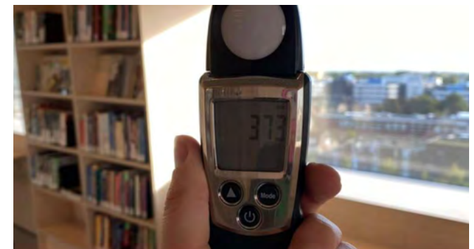
Fijnstofmeter uit de Meet-o-theek

We bieden onderzoekers een scala aan mogelijkheden om een breed publiek te betrekken bij hun onderzoek. Inwoners in de regio krijgen de mogelijkheid om onderzoek te doen in en om hun eigen huis. In het project CurioUs organiseren we burgerwetenschapsprojecten, waarin deelnemers een onderzoeker helpen data te verzamelen en tegelijk zelf leren over het onderwerp en de principes van de wetenschap. Bovendien kunnen inwoners in de meetotheek gratis meetinstrumenten lenen, van fijnstof- en decibelmeters tot een UV-zonnebrandcamera.