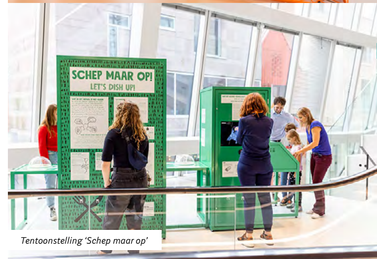
Tentoonstelling 'Schep maar op'