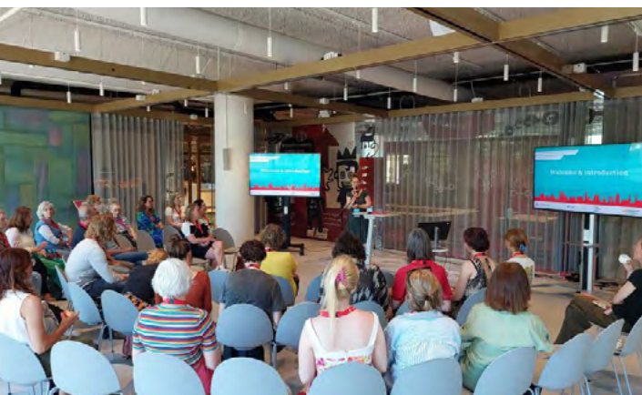
Aletta's Regional Year Challenge

Gezamenlijke profilering van Noord-Nederland als dé regio om gezondheid te studeren. Het is uniek dat er 1 platform is waar onderwijs rondom gezondheid wordt aangeboden.