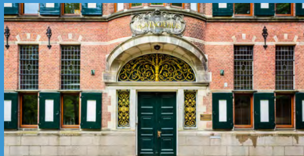
Provinciehuis Groningen.

De provincie Groningen vroeg Aletta het hoofdstuk over gezondheid te schrijven voor het thematisch programmaplan 2024-2029 van het Nationaal Programma Groningen. De procesbegeleiding deed Aletta Advies. Voor de paragraaf brachten we via Baanbrekende Beraden beleidsmakers, onderzoekers en professionals en ervaringsdeskundigen samen. We interpreteerden gezondheid breed en koppelden de beleidsdoelen aan collectieve preventie, bestaanszekerheid, maatschappelijke voorzieningen en het gebruik van data. We rondde de opdracht binnen de gestelde termijn van twee maanden af. Het hoofdstuk werd geaccordeerd door het netwerk Gezond Groningen en Gedeputeerde Staten en het programmaplan werd vastgesteld door Provinciale Staten en het bestuur van Nationaal Programma Groningen. Dit beleidskader vormt weer de basis voor het Provinciale Uitvoeringsprogramma Gezondheid 2024-2025 (met twee vervolgoopdrachten voor Aletta: project Maatregelen voor een gezonde leefomgeving en Festival gezondheidsvermogen) en geeft richting voor de Sociale Agenda van Nij Begun .