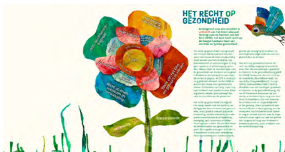
Het manifest: Kinderrechten in preventie, ondersteuning en zorg