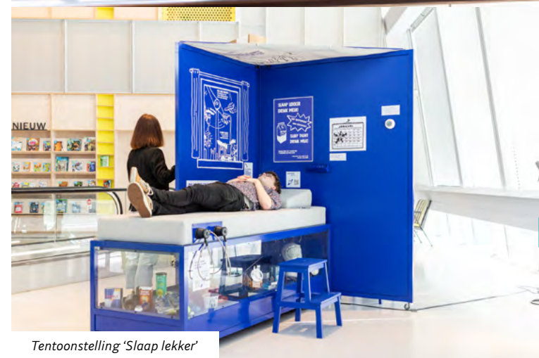
Tentoonstelling 'Slaap lekker'