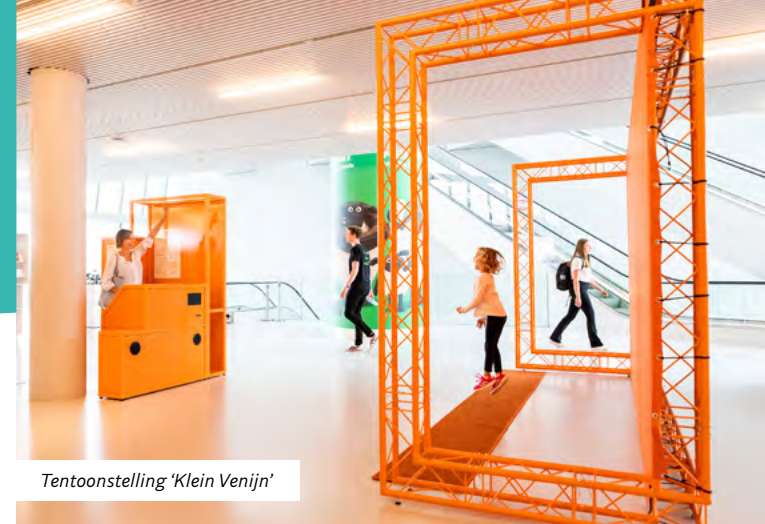
Tentoonstelling 'Klein Venijn'

Jaarlijks 2 burgerwetenschapsprojecten met Science LinX en Forum Groningen. Hierbij hoort een meetotheek waarin wekelijks uitleg en uitleen van meetinstrumenten plaatsvinden. Met Biblionet Groningen plannen we uitbreiding van de meetotheek in de hele provincie.