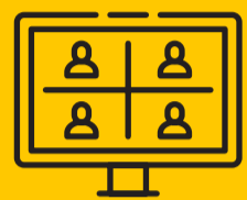
Landelijk Overleg Kwaliteitszorg

Na publicatie door de CDHO van de opleidingen die aangekondigd zijn (uiterlijk 30 maart of 30 september), deelt het UNL bureau dit met het Landelijk overleg Kwaliteitszorg (LOK).